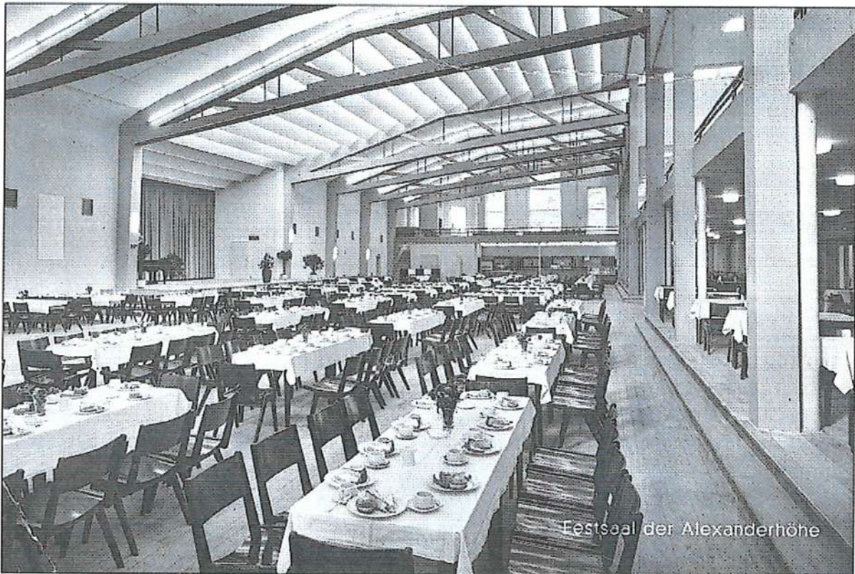
Blick in die "alte Halle".

Vom 10. bis 19. September 1976, reiste eine große Gruppe des IBSV zur Steubenparade nach New York. Von den Marschteilnehmern des IBSV stellte die