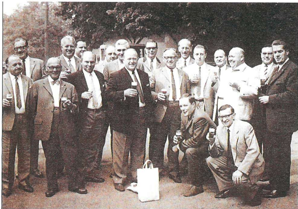
Herrenausflug 1967 Offz. und Uffz. Korps 3. Kompanie.

Ein weiteres Ereignis des Jahres 1990 war die Weihe der neuen Kompaniefahne. Die Neuanschaffung der Kompaniefahne war nötig geworden, weil die alte so verschlissen war, dass eine zuerst vorgesehene Reparatur das ursprüngliche Bild der Fahne völlig verändert hätte.