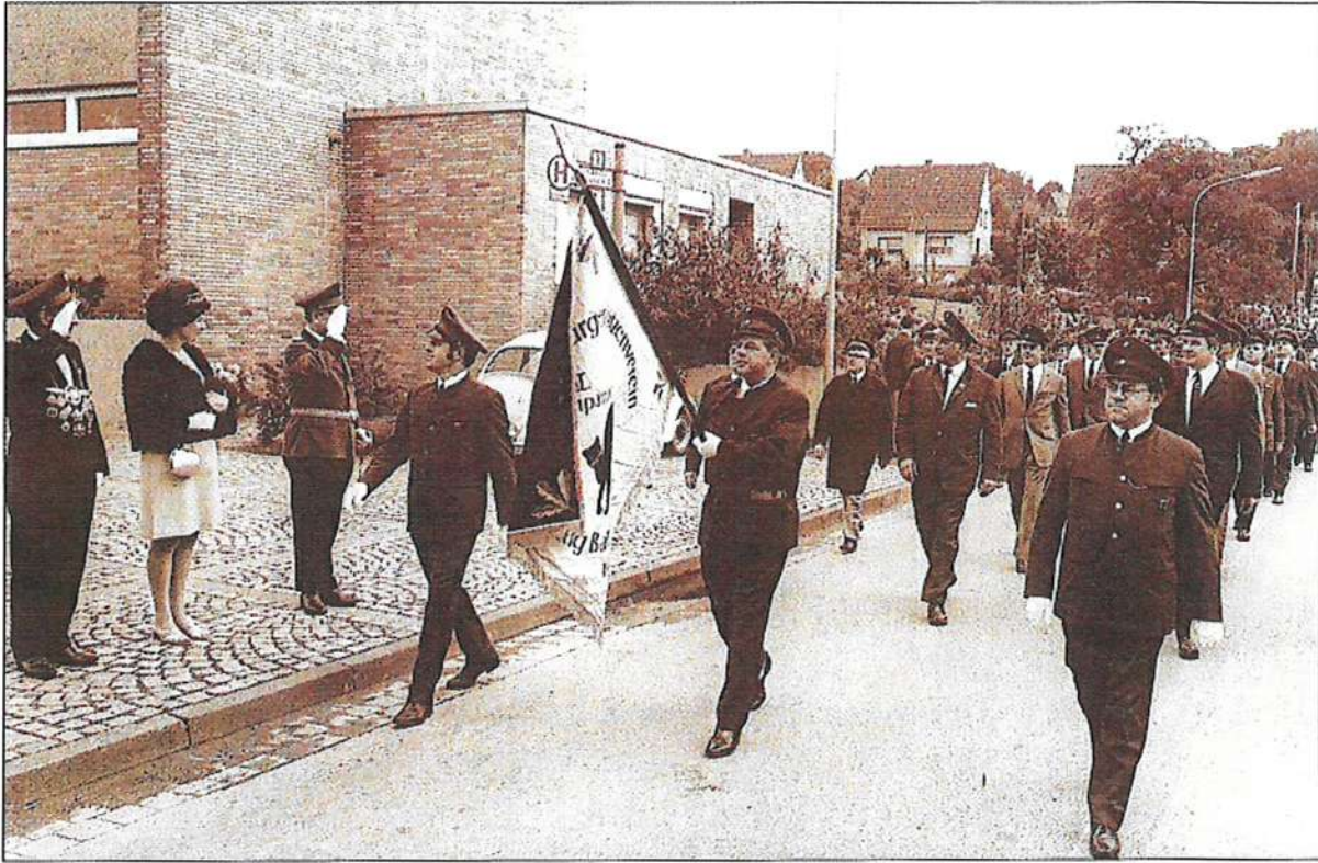
Im Wandel der Zeit: Die Balkenkater zum Schützenfest in Sümmeren.

durch seine gewinnende, jedoch auch bestimmende Art, der „Dritten“ weiteren Auftrieb zu geben und sie als weitaus stärkste Kompanie des IBSV zu führen.