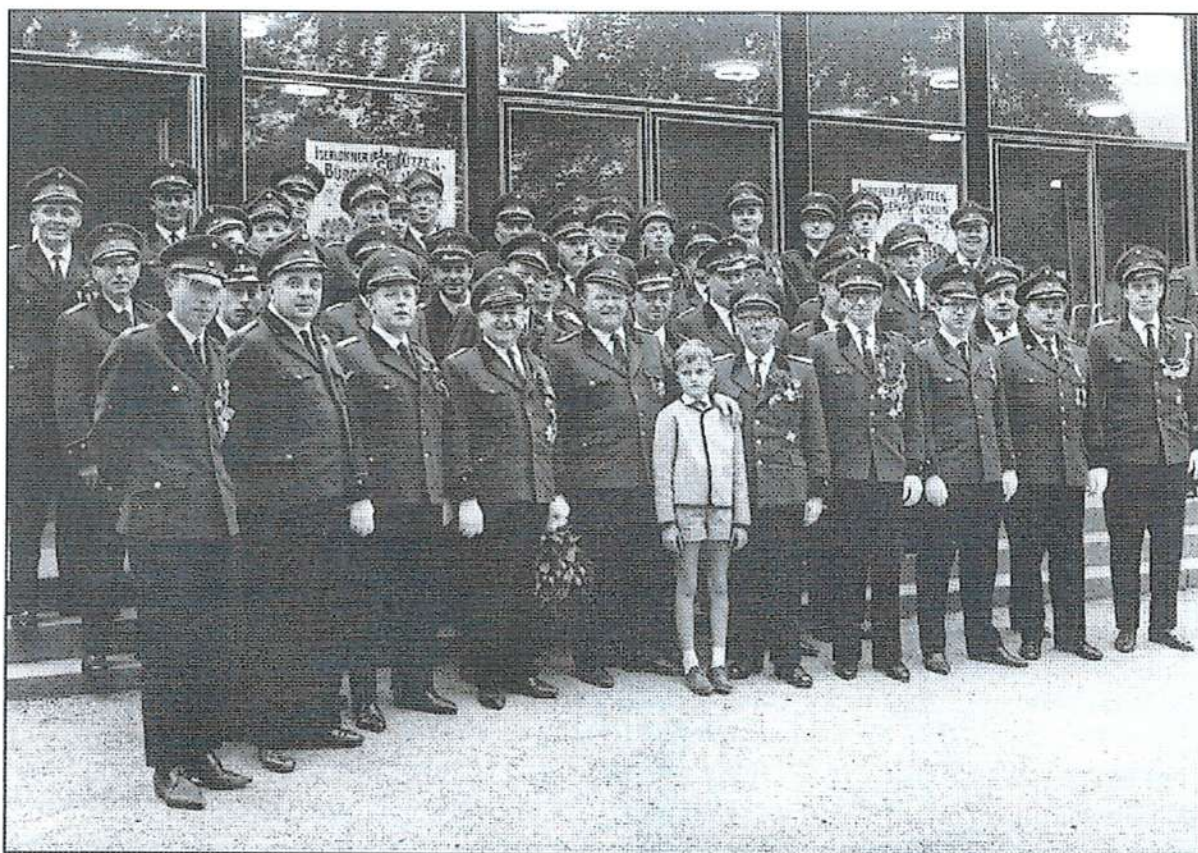
Offz. und Uffz. Korps 3. Kompanie 1964 vor der alten Halle.